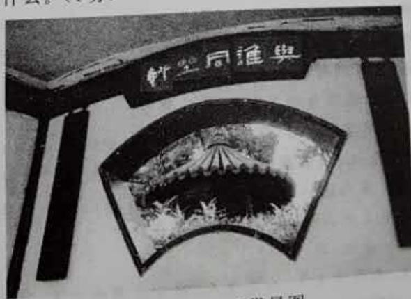
“与谁同坐轩”借景图