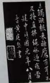
第四幅《奉同公择尚书咏茶碾煎啜三首》 (宋·黄庭坚)

6. 如果为茶室选择一副对联，上联为“石鼎火红诗咏后”，从下面句子中选择下联，最恰当的一项是(2分)