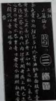
第三幅《茶录》 (宋·蔡襄)